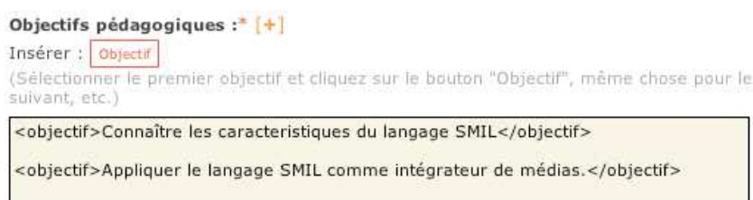
Figure 3. SPECS : balisage XML

Le mode d'opération du système au niveau des auteurs commence à partir du moment où l'on accède à l'interface auteur, qui est sécurisée par mot de passe. À l'intérieur, on dispose des panneaux et des boîtes à outils (figure 3). Lorsqu'il s'agit d'éditer, modifier ou réutiliser un document, l'auteur accède à une interface similaire à des formulaires Web, mais enrichie par plusieurs fonctionnalités interactives qui permettent de manipuler le balisage XML.