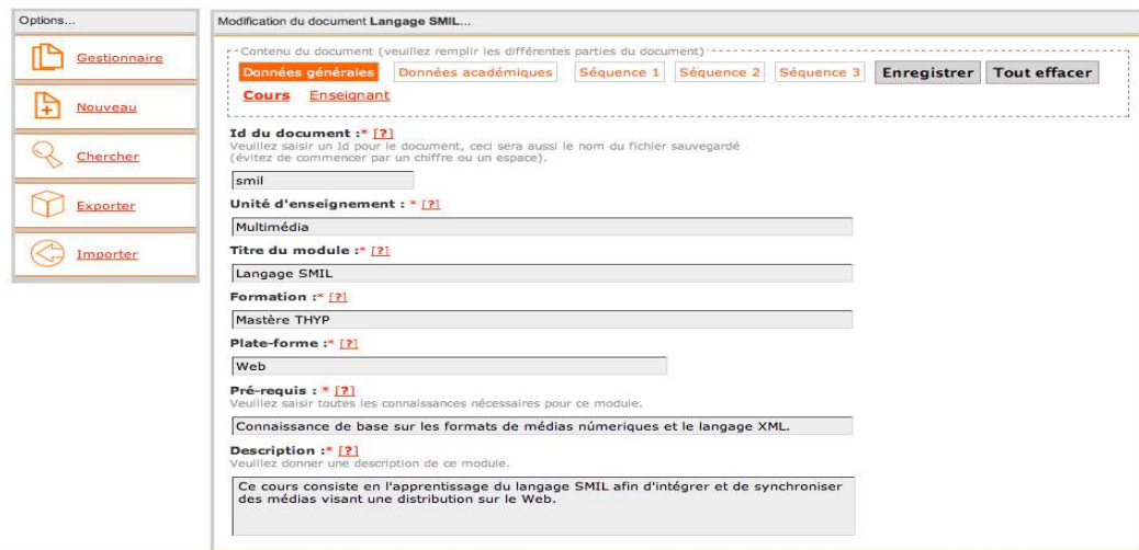
Figure 1. SPECS : Versions les plus récentes des interfaces de gestion et auteur